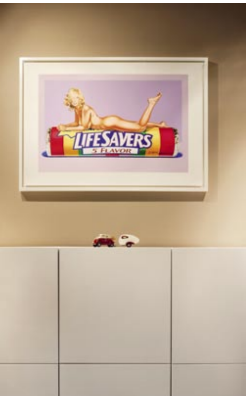
ВЪРХУ НИСКАТА МАСА TURN НА NUBE ITALIA (WWW.NUBEITALIA.COM) – СТАТУЕТКА PUPPY LOVE НА FRANCOIS VAN REENEN, ЮЖНА АФРИКА. НАД ШКАФА – LIFESAVERS, ПОРТРЕТ НА АКТРИСАТА УМА ТЪРМАН ОТ МЕЛ РАМОС, 2006 Г.